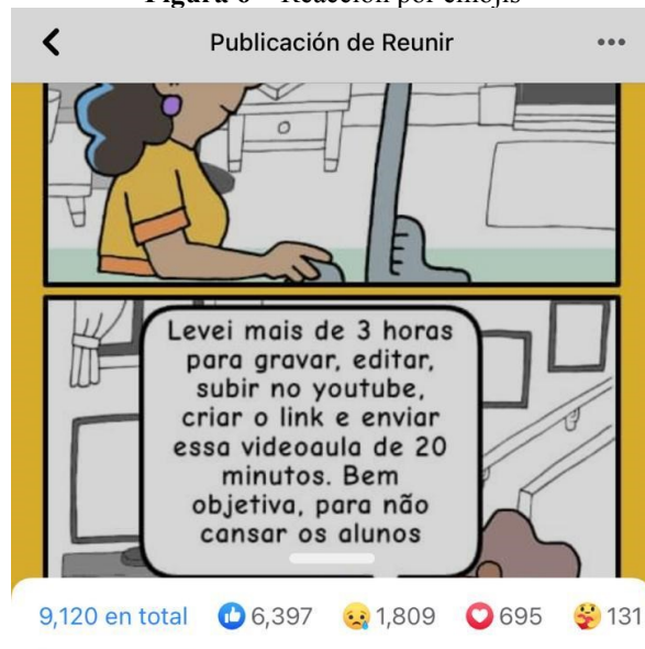
Figura 6 – Reacción por emojis