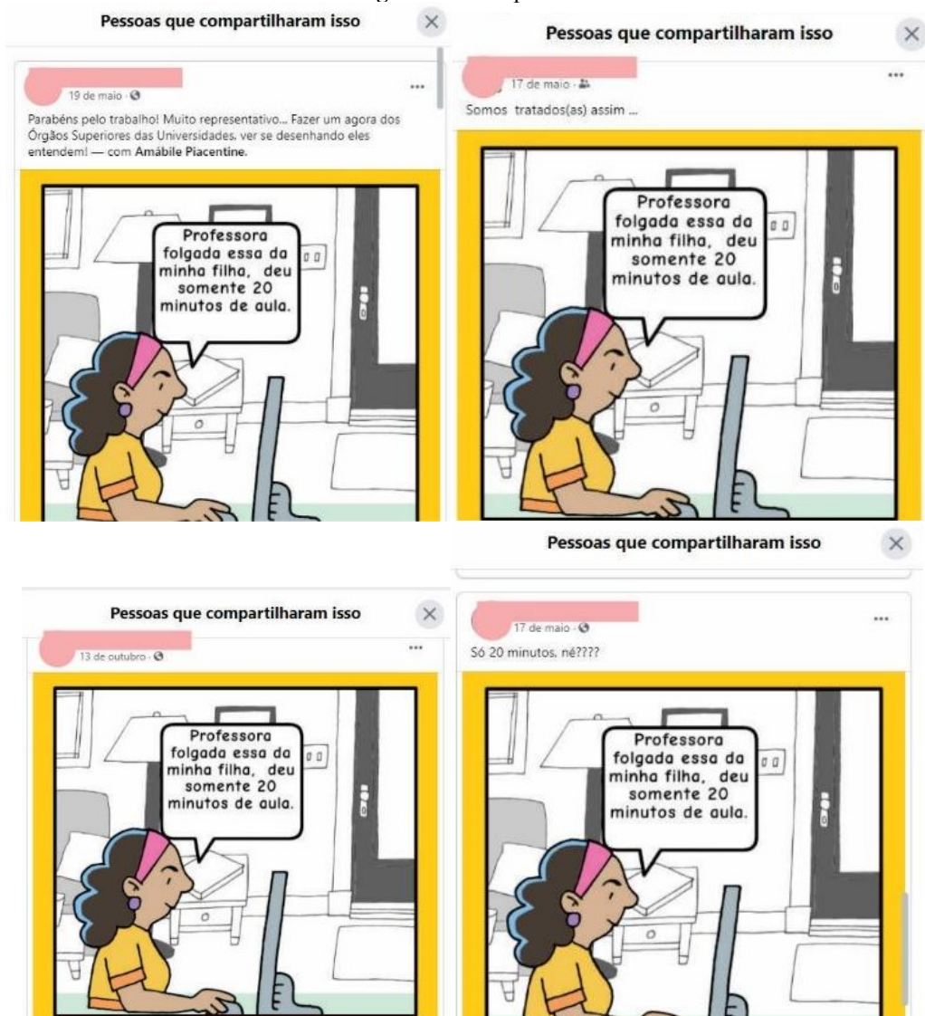
Figura 3 – Compartidas