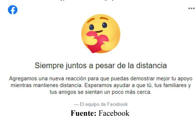
Figura 5 – Emojis pandémico

Además de estos emojis, Facebook suele tener disponibles reacciones temporarias, para uso en fechas o periodos específicos, como una flor de “gratitud” en el día de las madres, o la bandera arcoíris a lo largo de julio, por la celebración del orgullo LGBTQIA+.